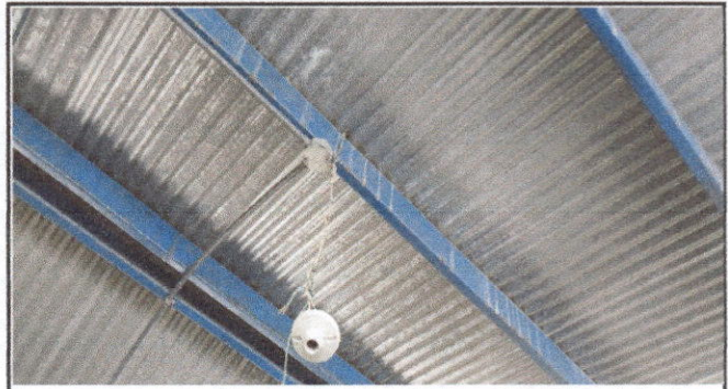
Foto 2: Reparación de Energía Eléctrica Módulo 1 tres aulas y corredor